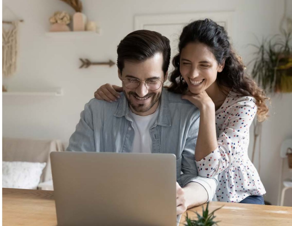
Chi ha realizzato il sogno di una casa di proprietà, può ritenersi fortunato

Il consulente bancario sa bene qual è la combinazione migliore e, insieme al cliente, analizza la sua situazione personale ed elabora piani di risparmio su misura. Prima si inizia, più è facile costruire un patrimonio. La Cassa Raiffeisen offre consulenza anche in materia di contributi e assicurazioni e, in particolare presso quella di Brunico, è disponibile un servizio specializzato in materia di famiglia e successione. "La banca ha una grande responsabilità nei confronti del cliente", sottolinea Pichler, "e per questo è importante dire no alle richieste di finanziamento non sostenibili". Più alto è il coefficiente di capitale proprio e la capacità di rimborso, maggiore è il prestito che può essere concesso e prima il sogno di un'abitazione di proprietà può realizzarsi. /ma