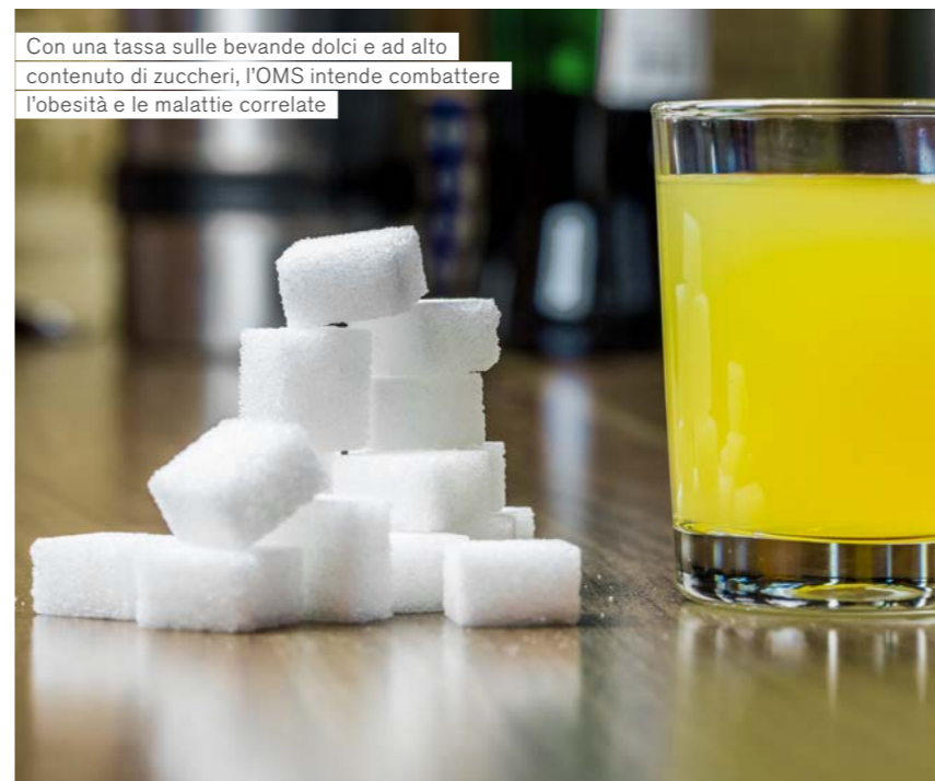
Con una tassa sulle bevande dolci e ad alto contenuto di zuccheri, l'OMS intende combattere l'obesità e le malattie correlate