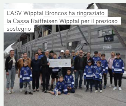
L'ASV Wipptal Broncos ha ringraziato la Cassa Raiffeisen Wipptal per il prezioso sostegno

Il 10 febbraio 2021, la Weihenstephan Arena, il palaghiaccio di Vipiteno, è crollata mettendo in difficoltà l'ASV Wipptal Broncos e ostacolando in particolar modo l'attività giovanile. Attualmente, i Broncos vengono "ospitati" in una pista di ghiaccio provvisoria. Al fine di sostenere i giocatori di hockey, a dicembre 2021,