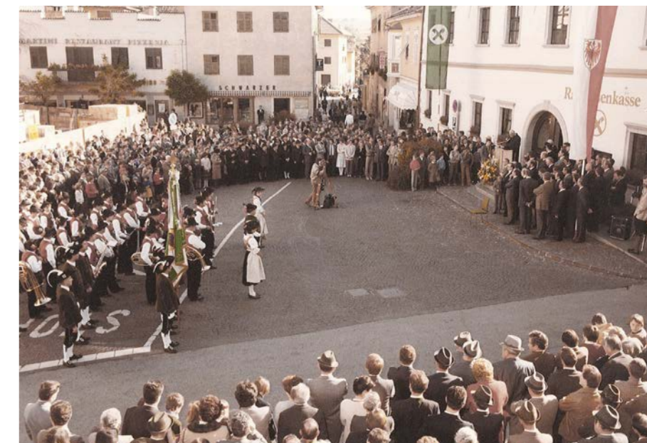
Inaugurazione della nuova sede a San Michele/Appiano, il 28 ottobre 1984

“Siamo consapevoli della nostra responsabilità sul territorio, nei confronti dei dipendenti e dell'ambiente”