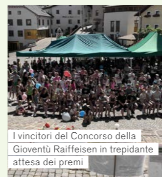
I vincitori del Concorso della Gioventù Raiffeisen in trepidante attesa dei premi