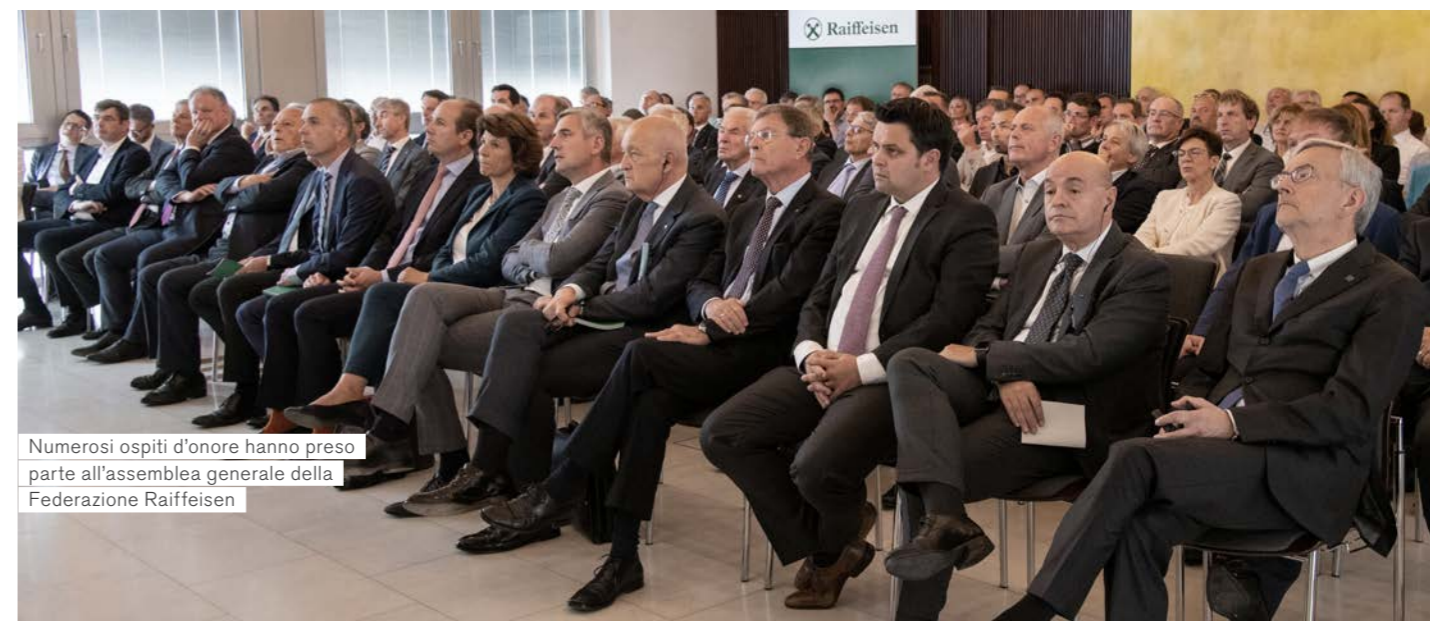
Numerosi ospiti d'onore hanno preso parte all'assemblea generale della Federazione Raiffeisen