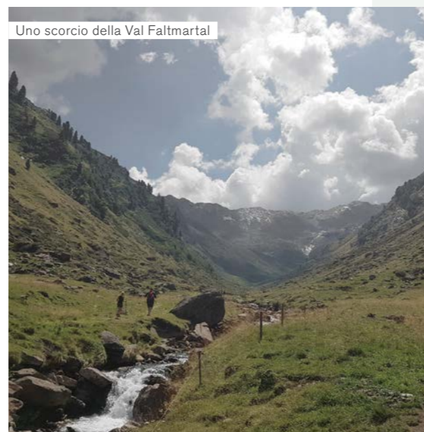
Uno scorcio della Val Faltmartal

Oggi però non ci fermiamo, perché il nostro cammino è ancora lungo. Dopo la malga, un sentiero conduce a destra sui ripidi pendii, fino a oltrepassare arbusti e piante del limite boschivo. Saliamo a ritmo sostenuto sul sentiero 5b fino all'area sciistica. Sotto di noi sorgono Malga Grünboden e la stazione a monte per chi vuole risparmiarsi la fatica. Ma siccome siamo in forma, ci godiamo la salita venendo ricompensati da una vista magnifica. Sopra la malga si apre un labirinto di roccia, che non ci lasciamo sfuggire prima di fare ritorno sul percorso panoramico. Superiamo un saliscendi ben lastricato in pietra fino a raggiungere Malga Valcanale, dove facciamo una sosta, soddisfatti di aver trovato posto, essendo questo