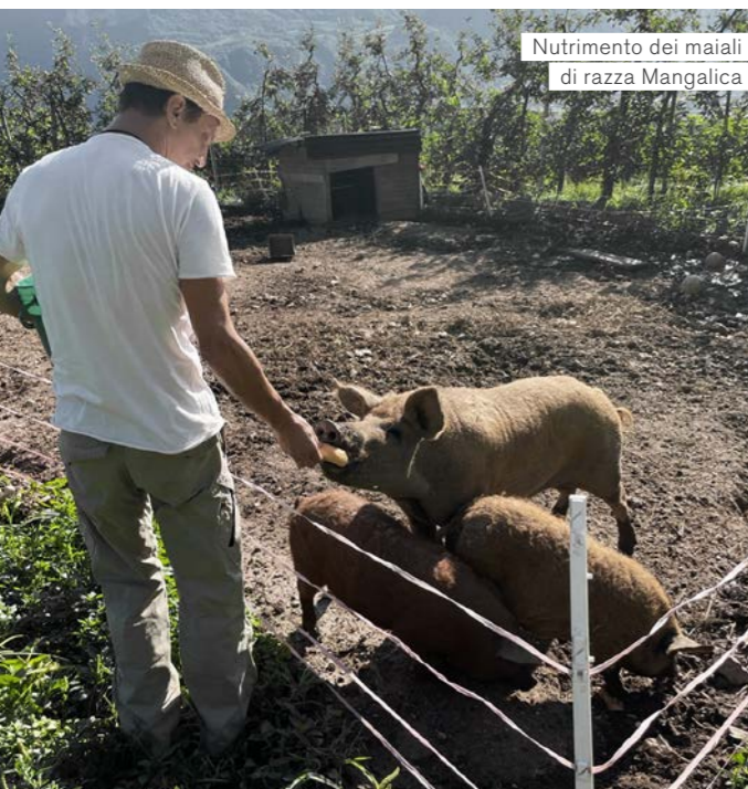
Nutrimiento dei maiali di razza Mangalica

Complessivamente, produce 300 diversi ortaggi da seme, che vengono forniti a clienti privati e a un ristorante di Bolzano.