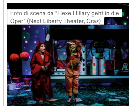
Foto di scena da "Hexe Hillary geht in die Oper" (Next Liberty Theater, Graz)

Grazie al sostegno di svariate Casse Raiffeisen, l'associazione Südtiroler Kulturinstitut è in grado di offrire ogni anno quattro tournée di rinomate compagnie teatrali per bambini, provenienti da Paesi germanofoni. Per quattro settimane, nell'arco dell'anno scolastico, questi gruppi girano l'Alto Adige dal lunedì al venerdì, mettendo in scena ogni giorno due spettacoli per gli alunni delle scuole elementari.