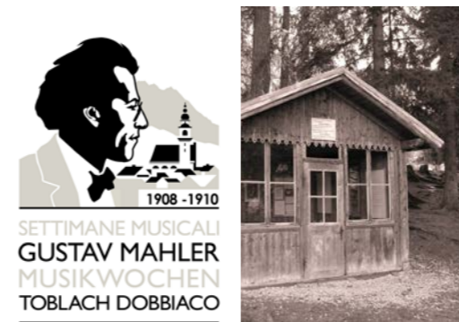
1908 - 1910 SETTIMANE MUSICALI GUSTAV MAHLER MUSIKWOCHEN TOBLACH DOBBIACO

Il cottage del compositore a Carbonin Vecchia, dove Gustav Mahler creò la "Nona Sinfonia", l'incompiuta "Decima" e "Il canto della terra"