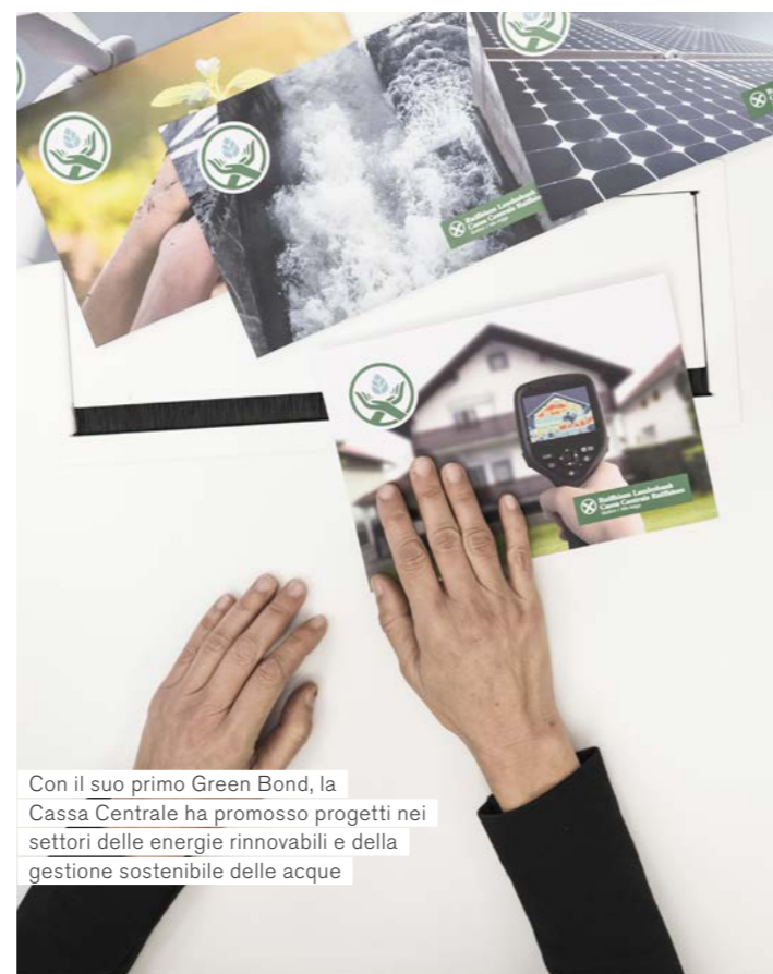
Con il suo primo Green Bond, la Cassa Centrale ha promosso progetti nei settori delle energie rinnovabili e della gestione sostenibile delle acque

La Cassa Centrale ha inoltre lanciato un “Sustainability Bond”, sempre per investitori retail, dell'importo di 15 milioni di euro. Il suo funzionamento è sostanzialmente identico a quello del Green Bond, ma interessa anche l'ambito sociale: ciò significa che, oltre ai progetti ecologici, vengono finanziate soprattutto iniziative socialmente sostenibili. A breve, anche in questo caso, sarà pubblicata una relazione sui progetti in questione.