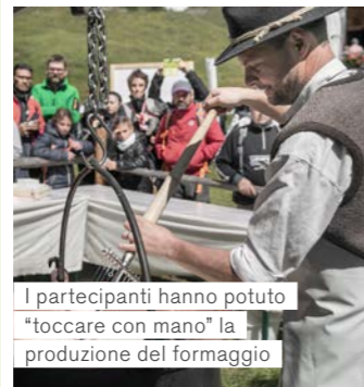
I partecipanti hanno potuto "toccare con mano" la produzione del formaggio

Il tradizionale Festival del Latte si è trasformato in un evento popolare per famiglie e amanti di questo pregiato alimento. Quest'anno, la rassegna organizzata dalla Federazione latterie dell'Alto Adige si è svolta per la prima volta in Val Sarentino dove, per due giorni, tutto è ruotato intorno all'"oro bianco".